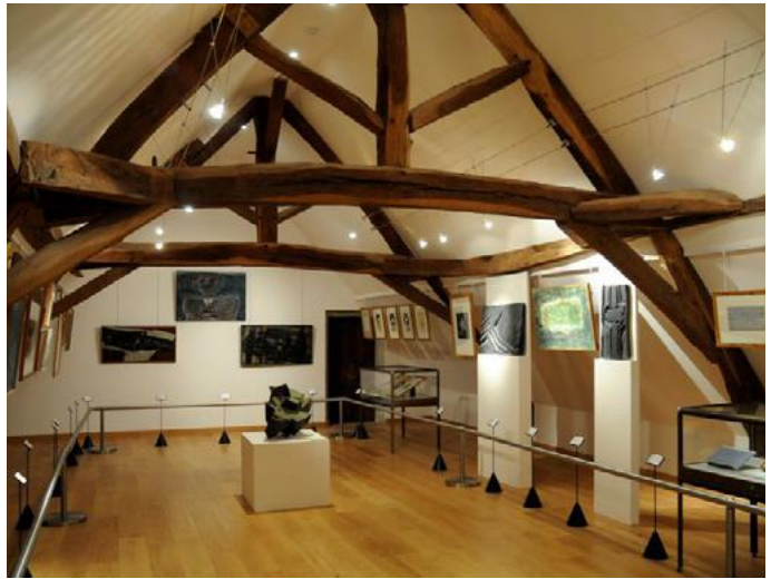
Collection Frénaud, musée Rolin.