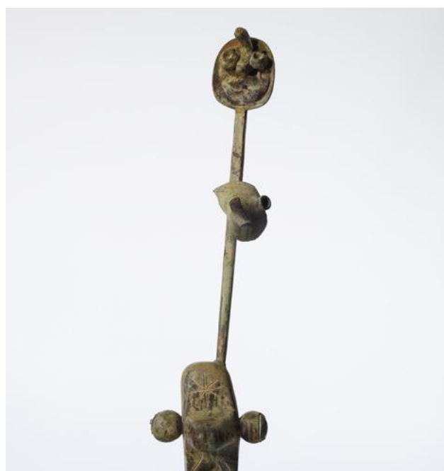
Joan Miró : Jeune fille rêvant de l'évasion, 1969. Fundació Joan Miró, Barcelona