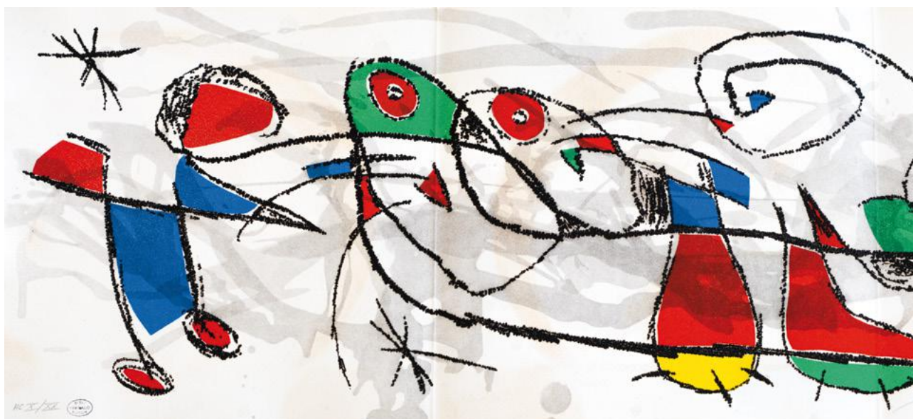
André Frénaud : Joan Miró et l'émancipation définitive de la queue du chat, trois eaux-fortes originales de Miró. Edition Maeght. Bibliothèque d'Autun

Ce dispositif scénographique s'amorce dès la cour du musée pour donner au visiteur un fil conducteur fort et identifiable tout au long de son cheminement.