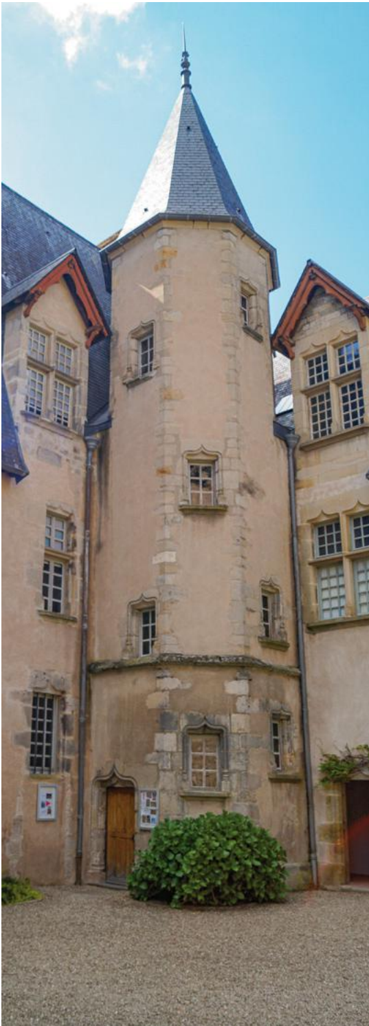
Musée Rolin, cour intérieure.