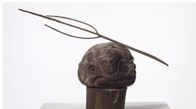
Joan Miró : Tête et oiseau , 1966. Fundació Joan Miró, Barcelona