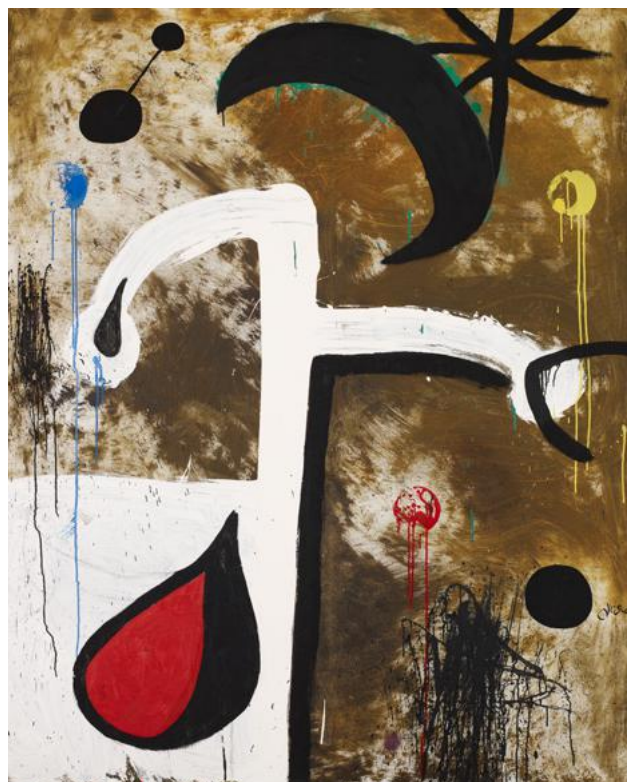
Joan Miró : Femme devant la lune , 1974. Fundació Joan Miró, Barcelona

fantaisie en forme de boniment pour amuser joan miró