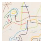
Salle 1 : Projection du film d'Albert Solé Bruset « Joan Miró. Le feu intérieur » (52' - France - 2018)

Le visiteur découvrira l'exposition déclinant au fil du temps l'évolution de la pensée et des réalisations de l'artiste.