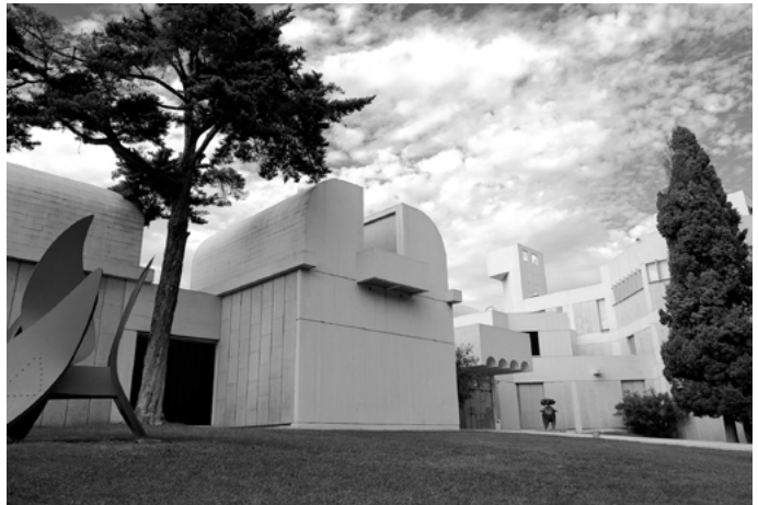
The Fundació Joan Miró, Barcelona.