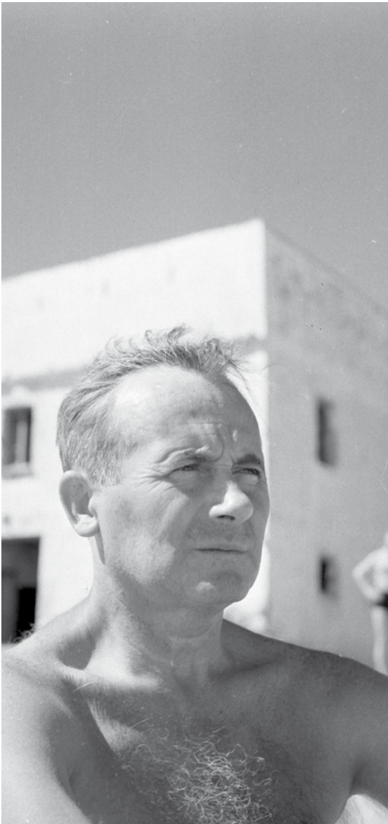
Portrait of Joan Miró in Mont-roig's beach, 1946-1950.