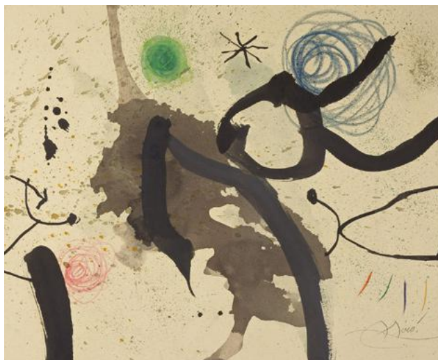
Joan Miró : Sans titre, 1951. Collection privée

A travers une riche sélection d'œuvres issues de collections publiques et privées, nous vous invitons à découvrir ou redécouvrir les domaines privilégiés des recherches esthétiques de l'artiste où s'expriment non seulement son profond attachement à la terre mais aussi une vision personnelle de la création artistique abolissant les frontières entre les êtres et les choses.