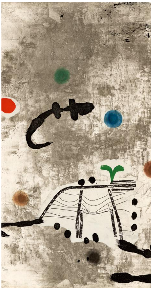
Joan Miró : Personnages et étoiles II , 1979. Fundació Joan Miró, Barcelona

En ce sens, l'exposition déroule le triptyque nature-poésie-arts visuels à travers un choix d'œuvres qui permet d'éclairer le sens de la démarche et les questionnements qu'elle porte en elle à l'heure de rencontres avec l'Histoire et la tradition moderne.