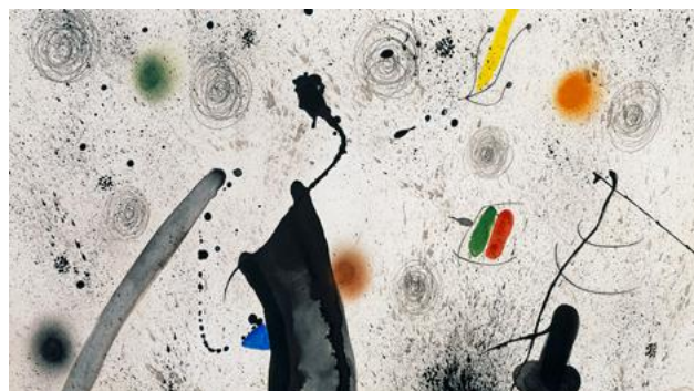
Joan Miró : Personnage, oiseaux , 1977. Collection privée