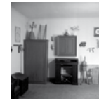
Salle 4 : Trois photographies de Joaquim Gomis Bibliothèque