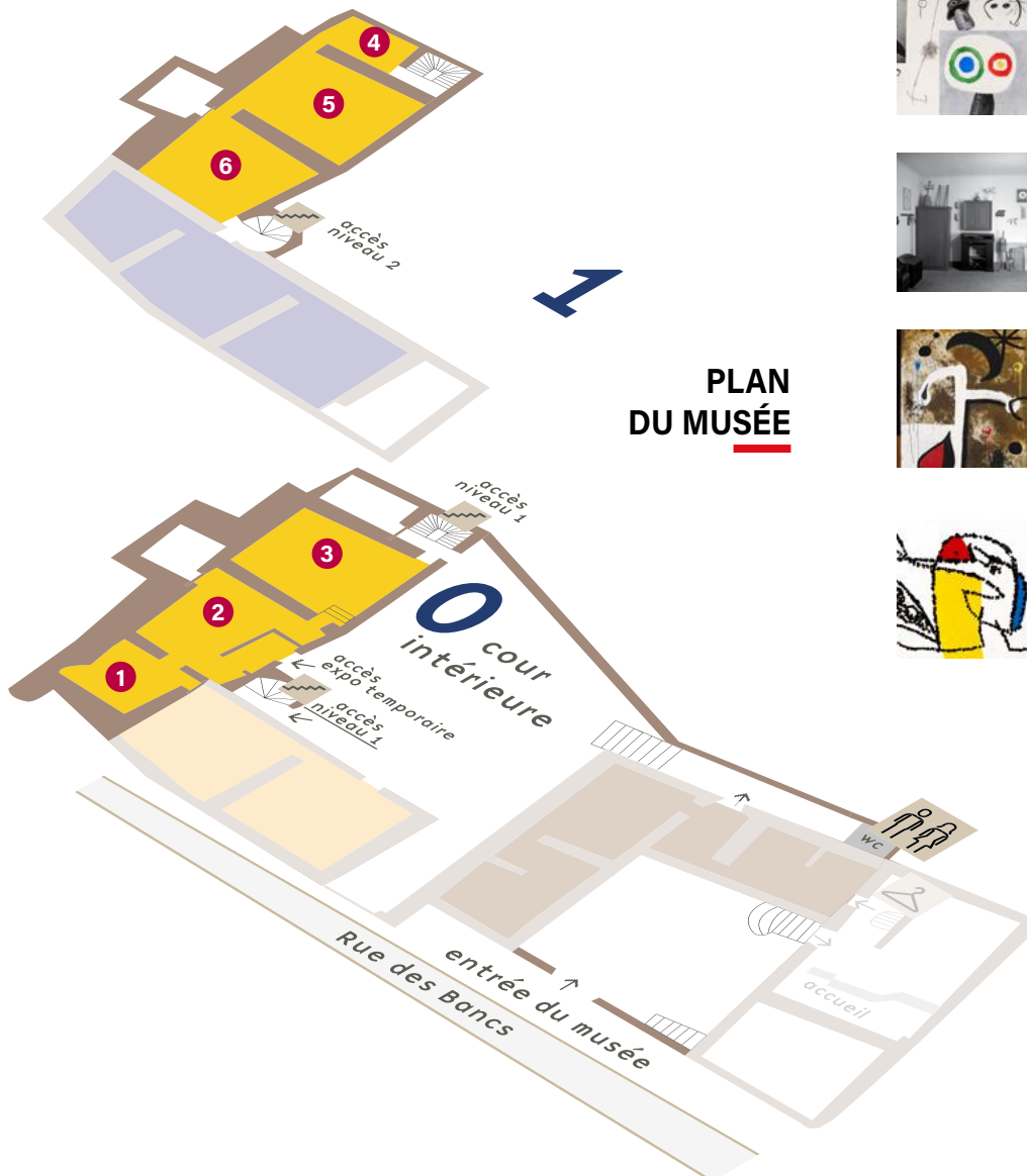
PLAN DU MUSÉE